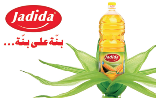
Jadida - Lancement Huile