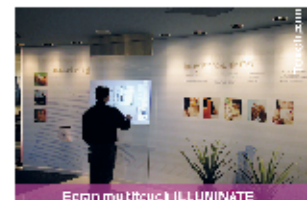
Écran mur interactif ILLUMINATE