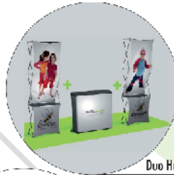
Duo Hello Xpression