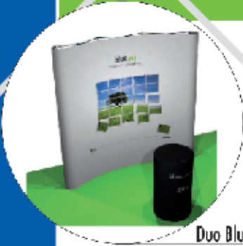
Duo Blue 3x3